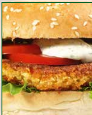
Burger und Röstis