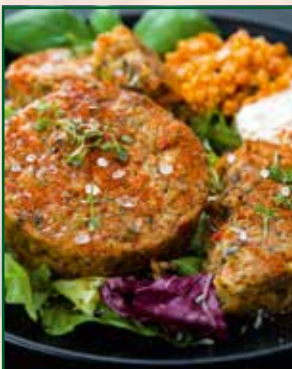
Bratlinge und Frikadellen

FÜR VEGETARISCHE, FLEISCHÄHNLICHE PRODUKTE