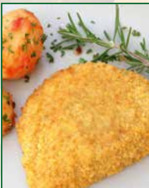
„Cordon Bleu“ und Schnitzel